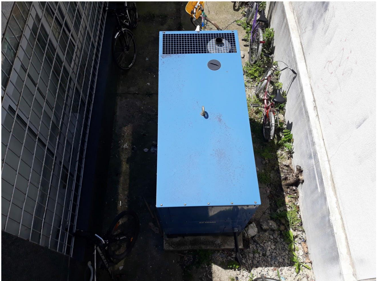
Позиција дизел агрегата

Од агрегата у дворишту зграде енергетски каблови се полажу у укупан канал до фасаде. По фасади се постављају SAPA цеви заштићене регалом дуж зида фасаде уз олук до продора у зид ка просторији унутар зграде. Даље каблови иду по регалима у спуштеном плафону до ормана GRO-A (ATS 125A 4P). Мрежни каблови из ормана GRO, који се налази у приземљу зграде, постављају се на ормански развод и даље ка орману GRO-A. Од ормана GRO-A каблови се постављају вертикално навише у одговарајуће кабловске регале ка потрошачким орманима.