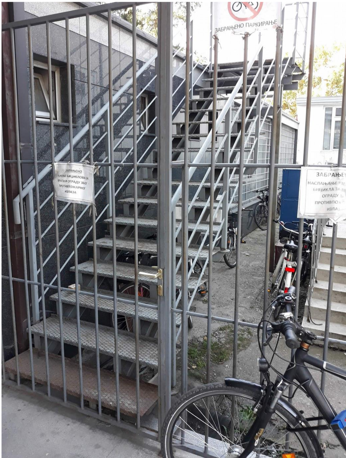
Изглед протипожарног степеништа са приземља