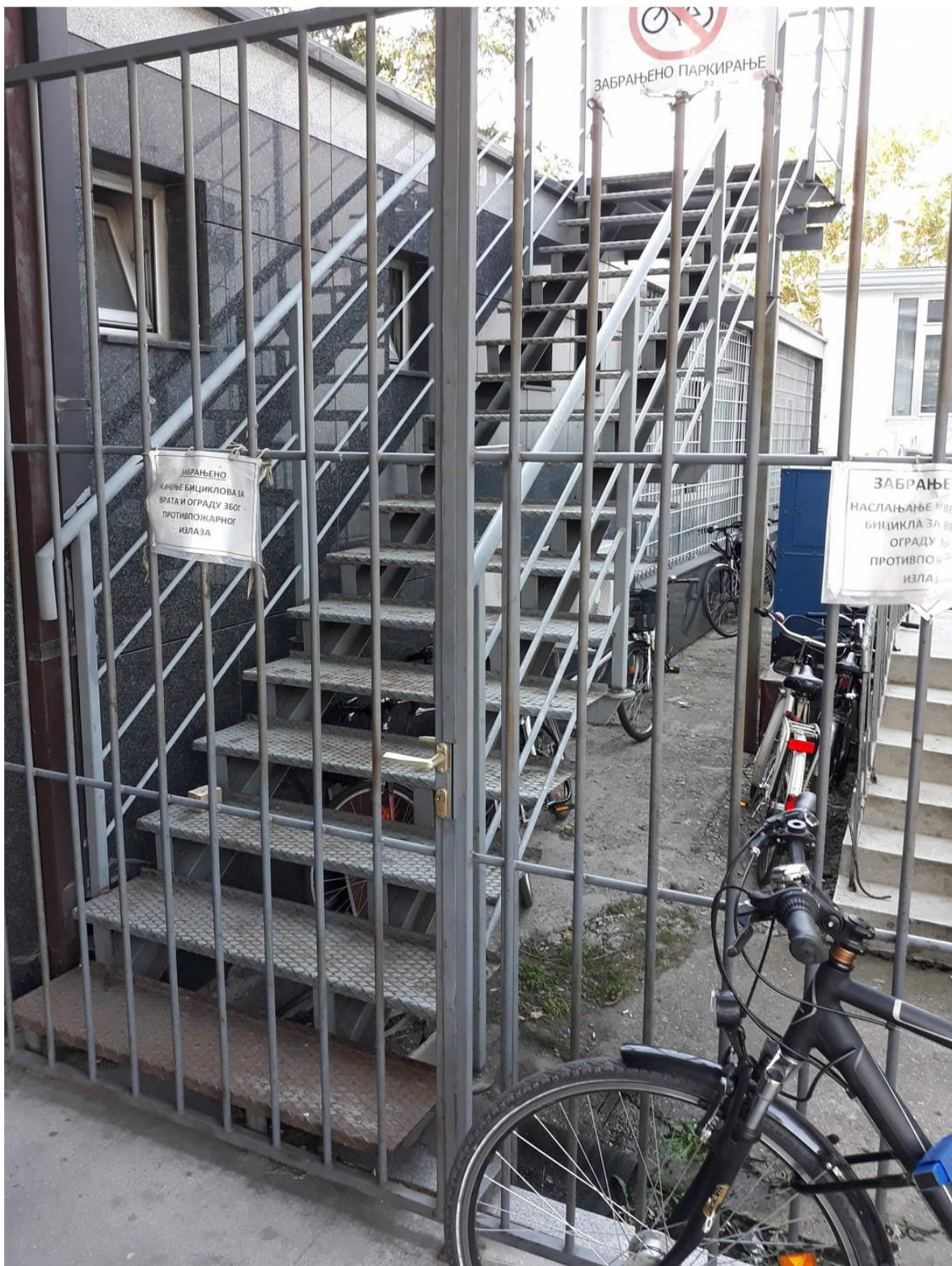
Изглед противпожарног степеништа са приземља